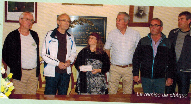
La remise de chèque

L'Amicale des Coureurs Agéens a su séduire les coureurs grâce au nouveau concept de la célèbre Champenoise, ce semi-marathon festif. Cette année, 1 euro par coureur inscrit, était destiné à aider l'association Trans-